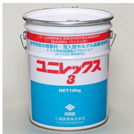
公共建築協会 建築材料等評価名簿掲載材料 吸水調整材(モルタル用) ユニレックス3 [18kg/缶] 塗布型吸水調整材 (EVA系合成樹脂エマルジョン)