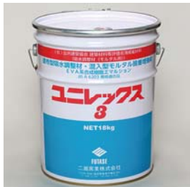
公共建築協会 建築材料等評価名簿掲載材料 吸水調整材(モルタル用) ユニレックス3 [18kg/缶] 塗布型吸水調整材 (EVA系合成樹脂エマルジョン)