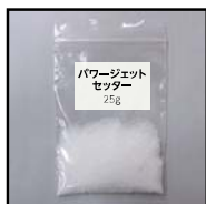
硬化時間調整材 パワージェットセッター (25gポリ袋)

パワージェット24Nパックは、橋梁の伸縮装置の取換え工事用の材料として作業性を追求しつつ、3時間で24N/mm 2 以上の圧縮強度を発現する現場練混ぜ用の超速硬コンクリートパックです。超速硬プレミックスモルタルと粗骨材(砂利)に加え、硬化時間調整材を現場での施工・配合管理がしやすい荷姿でご用意しています。