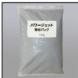
粗骨材 砂利パック (15kgポリ袋)