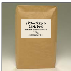
モルタルパック パワージェット24N (20kg紙袋)