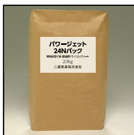
モルタルパック パワージェット24N (20kg紙袋)