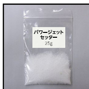
硬化時間調整材 パワージェットセッター (25gポリ袋)

パワージェット24Nパックは、橋梁の伸縮装置の取換え工事用の材料として作業性を追求しつつ、3時間で24N/mm 2 以上の圧縮強度を発現する現場練混ぜ用の超速硬コンクリートパックです。超速硬プレミックスモルタルと粗骨材(砂利)に加え、硬化時間調整材を現場での施工・配合管理がしやすい荷姿でご用意しています。