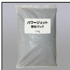
粗骨材 砂利パック (15kgポリ袋)