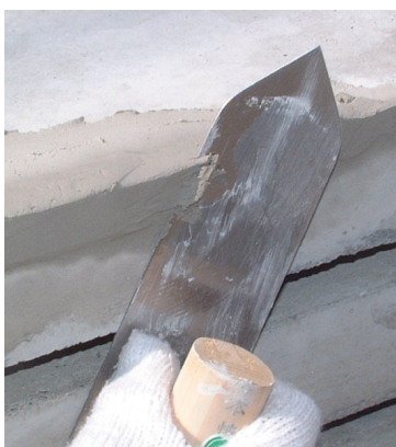
▲少し余分に載せて、コテで軽く切るように施工してください。