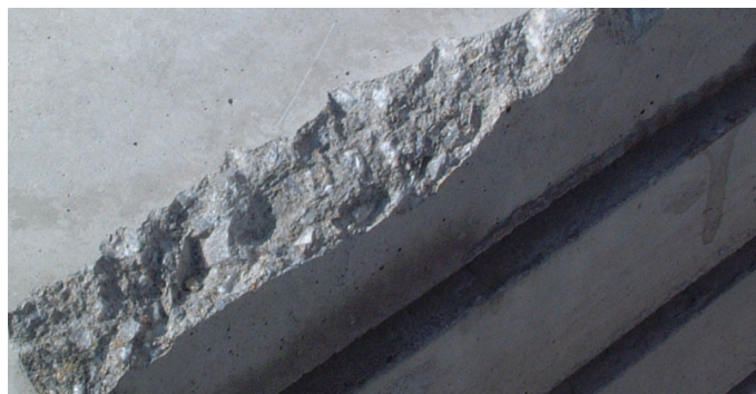
▲このような欠損部が