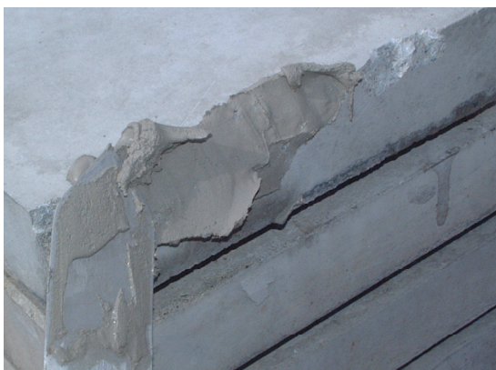
▲コテでそのまま局部に塗り付けてください。(水湿しや下地処理は必要ありません)