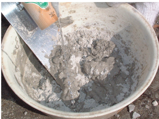
▲適量のベンリーSと水道水とをボウルに開けてよく混練してください。