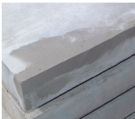
▲通常のモルタルのようにコテ押さえで仕上げる事が出来ます。