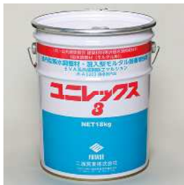
(一社) 公共建築協会 建築材料等評価名簿掲載材料 吸水調整材 (モルタル用) ユニレックス3 [18kg/缶] 塗布型吸水調整材 (EVA系合成樹脂エマルジョン)