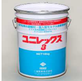
(一社)公共建築協会 建築材料等評価名簿掲載材料 吸水調整材(モルタル用) ユニレックス3 [18kg/缶] 塗布型吸水調整材 (EVA系合成樹脂エマルジョン)

JIS A 6916(C-2)規格 適合モルタルとして 使用される場合は、 ユニレックス3の混和量 (2.5kg)を必ず遵守して ください。